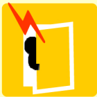
マグネットセンサー