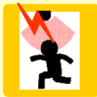
パッシングセンサー