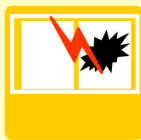
ガラス破壊センサー