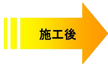
【パニックオープン自動ドア】