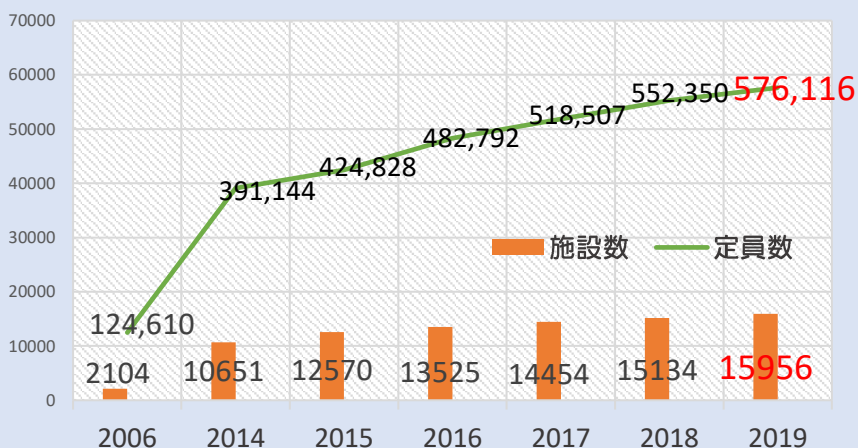
有料老人ホーム施設数と定員数