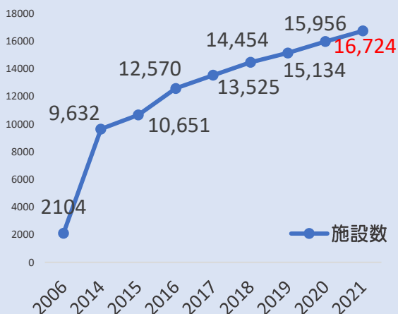
有料老人ホーム数の推移